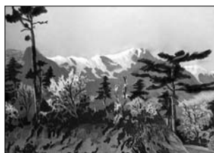
Е. Грабовецький. «Ай-Петрі» з серії «Пейзажі Криму». 1956. Папір, гуаш

ником у редакціях г. «Кримський комсомолец» (1937–41), «Красный Крым» (1944–52), «Боевая слава» (1945–47); у 1946–2000 – на Сімфероп. худож.-вироб. комбінаті. Учасник обл. (від 1945), респ. (від 1956), зарубіж. (від 1975) мист. виставок. Осн. галузі – станк. і книжк. графіка. У творчості приділяє увагу контраст. співвідношенням тонових плям, виділяючи у композиції гол. деталь. Автор пейзажів, портретів, картин на побут. та істор. теми. Роботи зберігаються у Сімфероп. ХМ, Крим. крає-