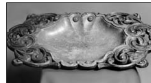
І. Грабовий. Блюдо «Святкове». 1997. Дерево, різьблення

мом Грабовський видав кн. «Друидотерапія» (1999), «Фантазія кримського леса» (2003; обидві – Сімферополь). ( Див. іл. на с. 206 ).